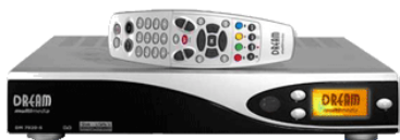
Set-Top-Box mit gewohnter Fernbedienung